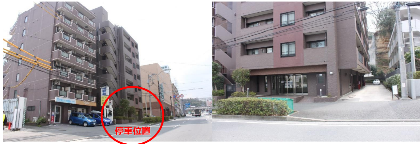
② サンヴェール戸塚