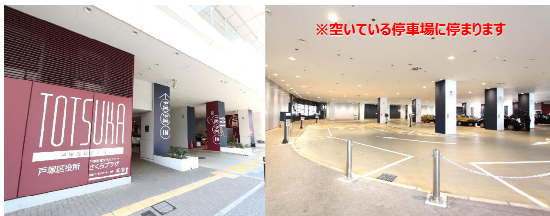
⑫ 戸塚区役所下駐車場