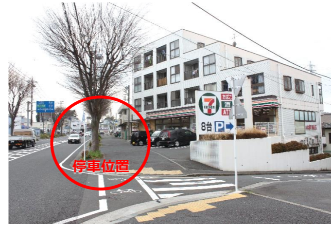
③ セブンイレブン前