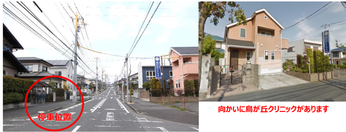
⑤ 鳥が丘クリニック向かい