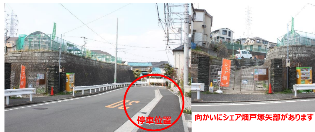
⑨ シェア畑戸塚矢部向かい