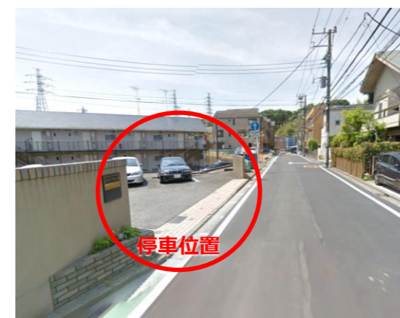
⑩ メゾンラフィーヌ