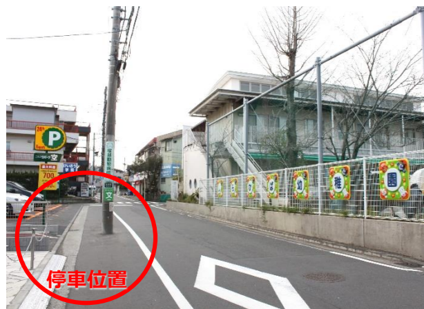
⑧ しらかば幼稚園向かい